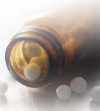
Homöopathie-Stiftung des Deutschen Zentralvereins homöopathischer Ärzte (DZVhÄ)

Zwei neue Untersuchungen widerlegen die von dem Schweizer Sozial- und Präventivmediziner Matthias Egger aufgestellte These, Homöopathie beruhe allein auf Placeboeffekten. Im Sommer 2005 sorgte die im Lancet veröffentlichte Meta-Analyse für großen Wirbel, die Fachzeitschrift hatte im Editorial bereits das „Ende der Homöopathie“ herbeigeschrieben. Die Zeitschriften Journal of Clinical Epidemiology und Homeopathy publizierten nun zwei Studien, in denen diese