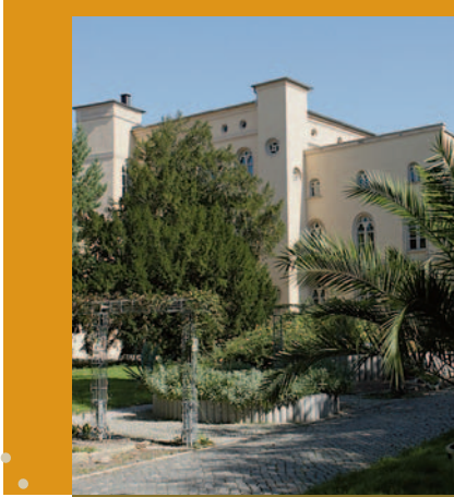
Lutze-Klinik Parkansicht mit homöopathischem Schaugarten

→ Eine homöopathische Praxis befand sich bis 1945 in der Lutze-Klinik.