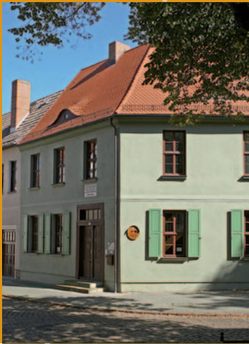
Hahnemann-Haus in Köthen