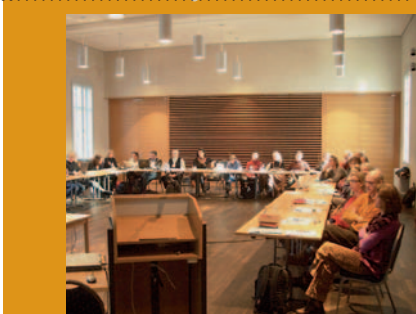
Dozentenkonferenz des DZVhÄ 2009 im Veranstaltungszentrum

→ Telefon: +49(0)3496-700 9925 . homoeopathie@bachstadt-koethen.de