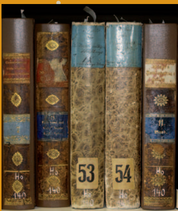
Europäische Bibliothek für Homöopathie Köthen

→ 1829 gründete sich anlässlich des 50. Doktorjubiläums von Hahnemann der Verein homöopathischer Ärzte (heute DZVhÄ – Deutscher Zentralverein homöopathischer Ärzte) in Köthen