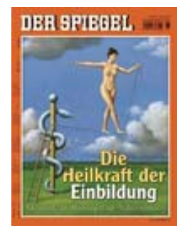
Der Spiegel, Nr. 26/ 25.6.07, Titelthema: „Die Heilkraft der Einbildung“