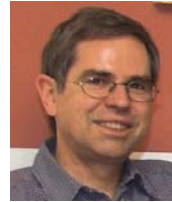
Udo Schipling • Systemische Aufstellun- gen. Familie als System – Systemische Familien 3 Aufsteller, 1 Methode. • Vortrag: Prophylaxe und Therapie ungeimpf- ter Kinder