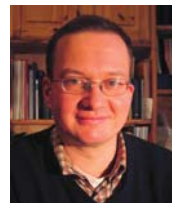
Ulrich Schuricht Wie sah Hahnemanns Arbeitsweise in der Praxis aus.