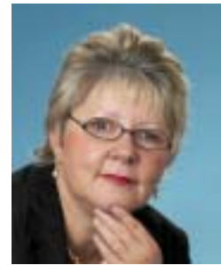
Marion Caspers-Merk, Parlamentarische Staatssekretärin im Bundesministerium für Gesundheit

Weitere Informationen: www.europarl.europa.eu