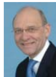
Staatssekretär im Bundesgesundheitsministerium Klaus Theo Schröder.