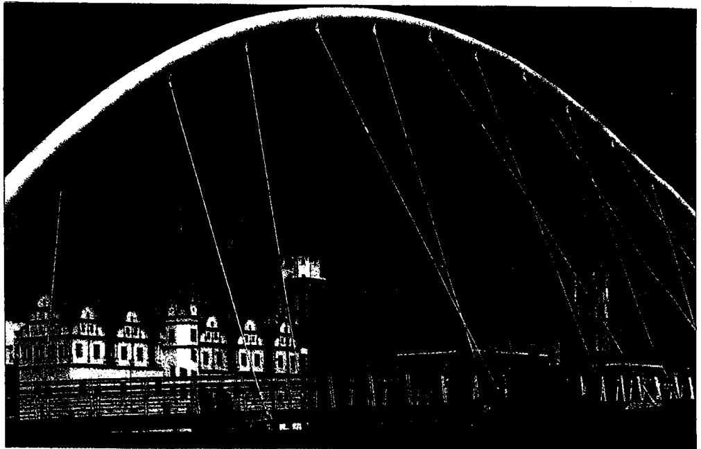
Mit Landschafts-Inseln in der Stadt reagieren Dessaus Stadtplaner auf den Rückgang der Bevölkerung. Das Foto zeigt Dessaus moderne Tiergartenbrücke, die sich über den Fluss Mulde spannt.

Die Städte Dessau und Köthen stehen beispielhaft für die Ideenvielfalt, die sich innerhalb der IBA herauskristallisiert haben. In Köthen (Anhalt) zum Beispiel leben heute 29 000 Menschen, 1969 waren es noch knapp 37 000. „Zwischen 2003 und 2008 wurden 1000 Wohnungen abgebrochen“, sagt Baudezernentin Ina Rauer. Weitere werden folgen. Im Bestand der städtischen Wohnungsgesellschaft WGK befinden sich momentan circa 3400 Wohnungen; für viele lassen sich keine Mieter finden.